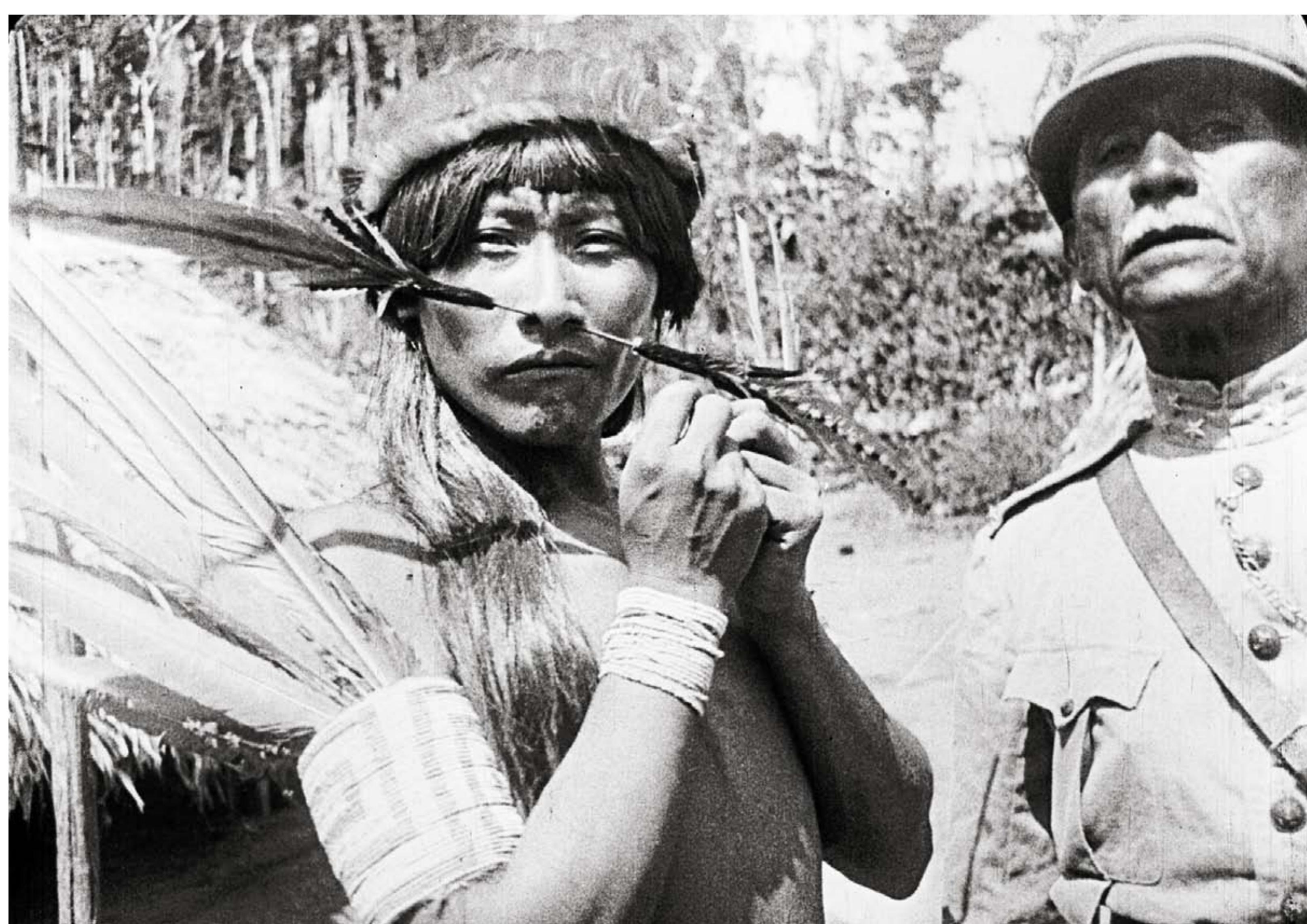
Cena do filme Patama, Luiz Thomaz Reis | Museu do Índio/Funai

Apesar de todos os tipos de violência sofridos pelos índios (física, cultural, espacial), eles continuam resistindo e criando novas formas de vida. Hoje, calcula-se que no Brasil existem 650 mil habitantes de 225 sociedades indígenas, falando 180 línguas.